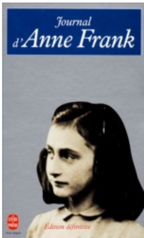
Module notice 1.1